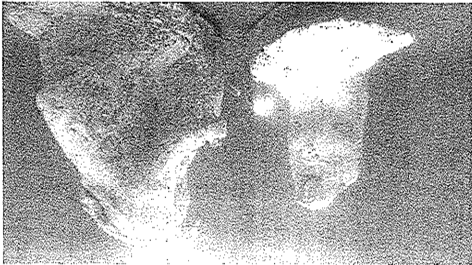
Immagine del presepe subacqueo di Capodimonte (VT)

I turisti e tutta la comunità saranno attratti dalle luminarie, che renderanno unica l'atmosfera passeggiando per le vie del centro storico, valorizzando il patrimonio artistico e monumentale di Capodimonte, tra cui il Prespepe Subacqueo che ogni anno attrae molti visitatori, rappresentando un unicum nell'intera provincia.